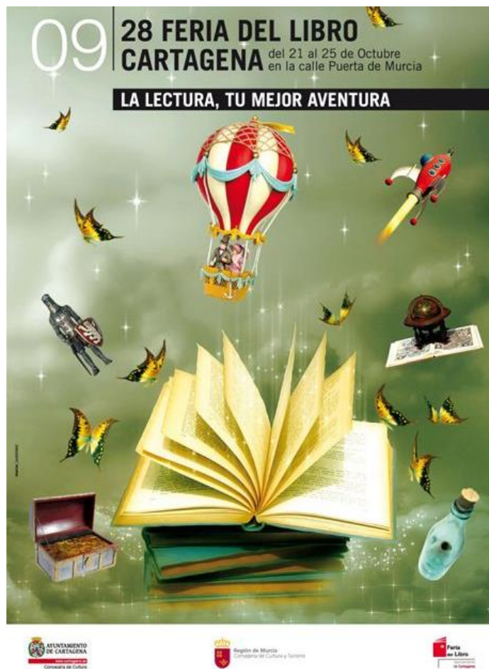
Cartel de la Feria del libro de Cartagena (España), 2009.

A partir de este cartel y de los documentos 1 y 2, explique lo que aporta la lectura.