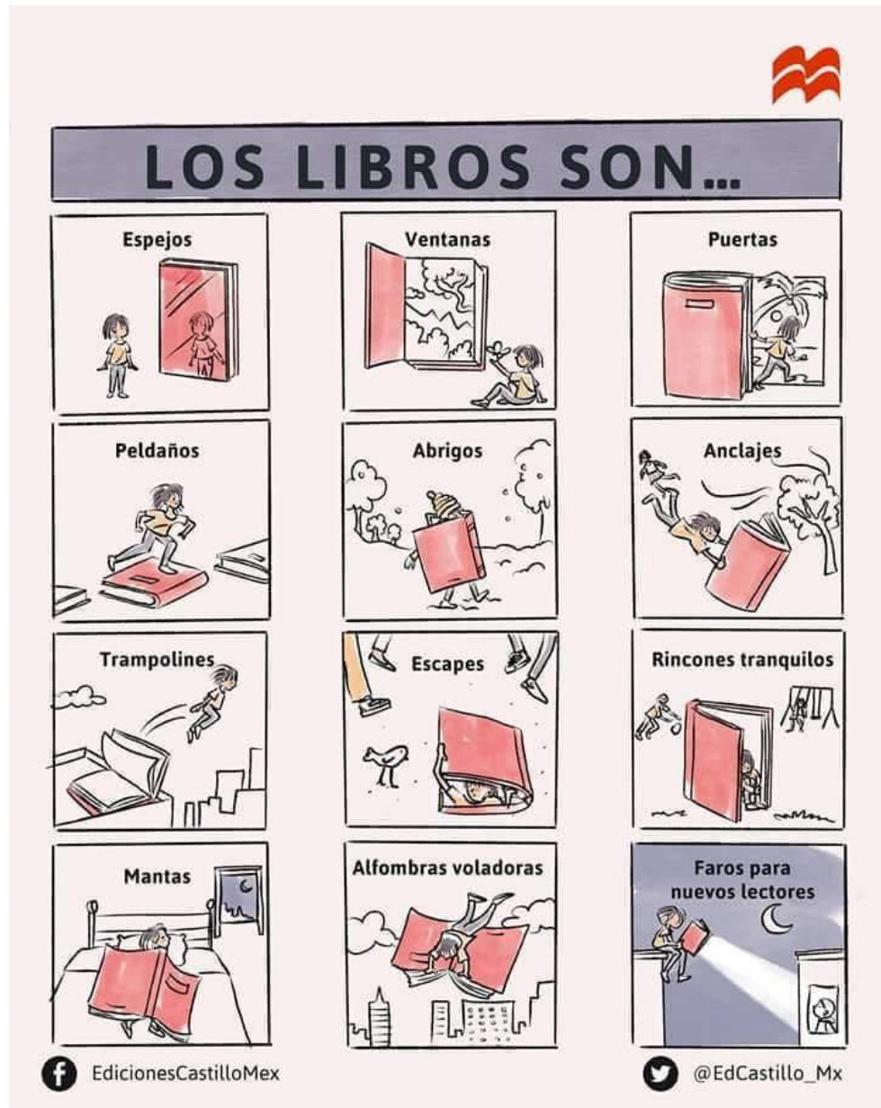
Cartel de las ediciones Castillo (México), 2018.