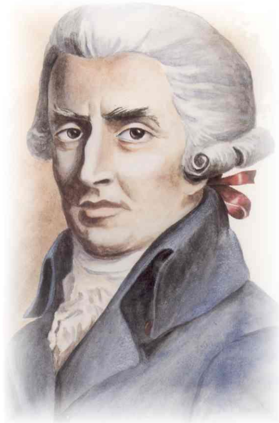
Document 2 :