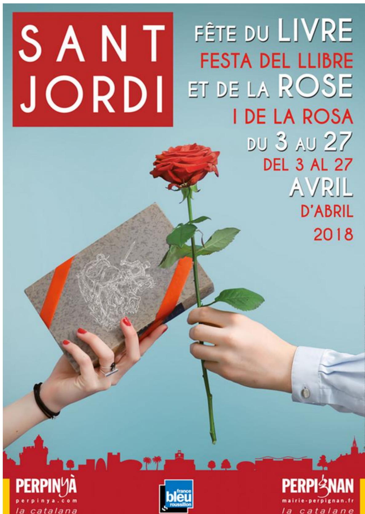
Document 2 : Cartell de la celebració de Sant Jordi, festa del llibre i de la rosa, a Perpinyà