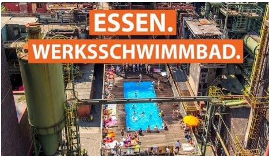
Das Werksschwimmbad in Essen: Baden im Industriedenkmal.

Sind historische Bauwerke nur Kulisse für Touristen-Selfies oder lebendige Orte für die Bevölkerung? Sollen sie originalgetreu erhalten werden oder sollen sie andere Funktionen bekommen? Erklären Sie Ihren Standpunkt und geben Sie konkrete Beispiele.