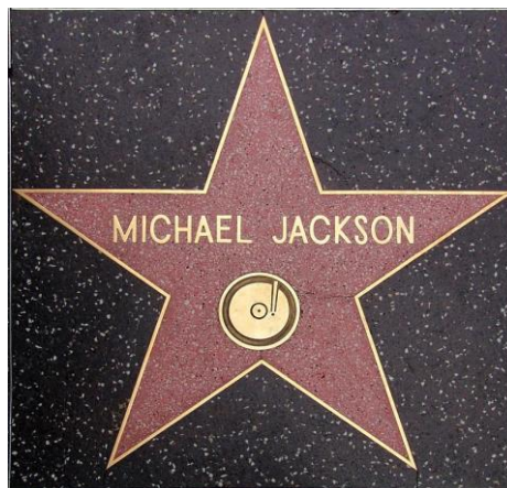
Walk of fame, Hollywood, USA