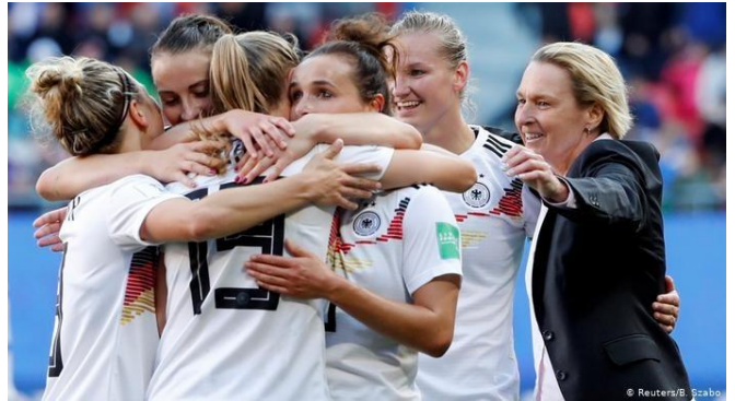
Die deutsche Elf holt immer mehr Zuschauer vor die Fernseher

Il s'agit de la photo d'une partie de l'équipe allemande de football féminin. On voit 5 joueuses accompagnées de leur entraîneur qui se prennent dans les bras dans un moment d'euphorie. Les joueuses portent le maillot de l'équipe nationale allemande (maillot blanc avec les couleurs du drapeau allemand -noir, rouge et jaune- sur la partie haute du maillot) et l'entraîneur une veste de tailleur noire.