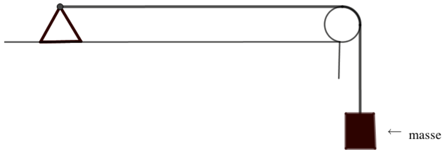
Illustration du montage.

On a relevé dans le tableau ci-dessous les fréquences fondamentales obtenues en pinçant la corde :