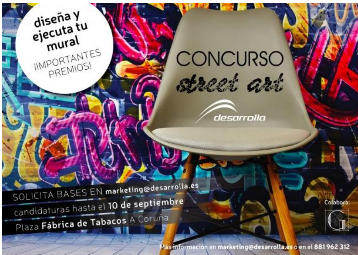
Cartel concurso de Desarrolla , empresa de construcción, 09/2018.

Apoyándose en el cartel de la empresa de construcción Desarrolla , explique qué concepciones del arte se oponen en los tres documentos.