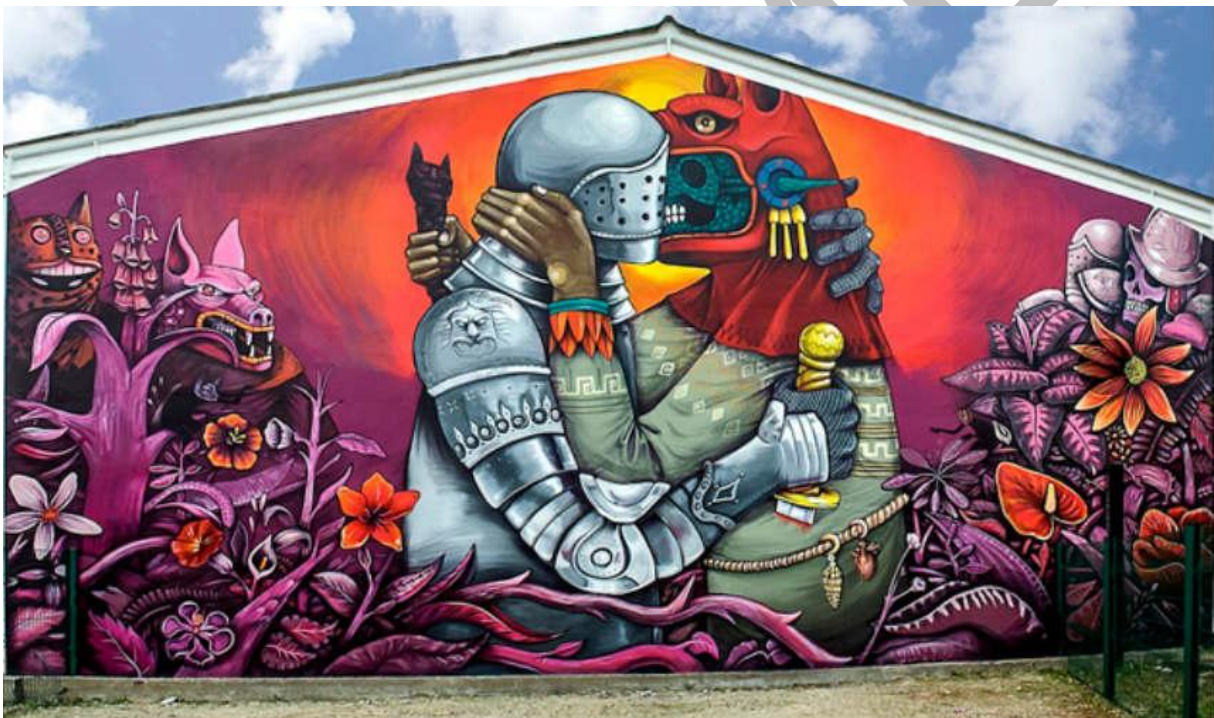
SANER (artista mexicano) – Street Art « Festival Cheminance », Fleury les Aubrais, Francia, 2018.