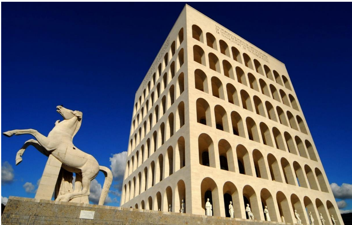
Palazzo della civiltà, Quartiere EUR, Roma (inizio della costruzione nel 1938)