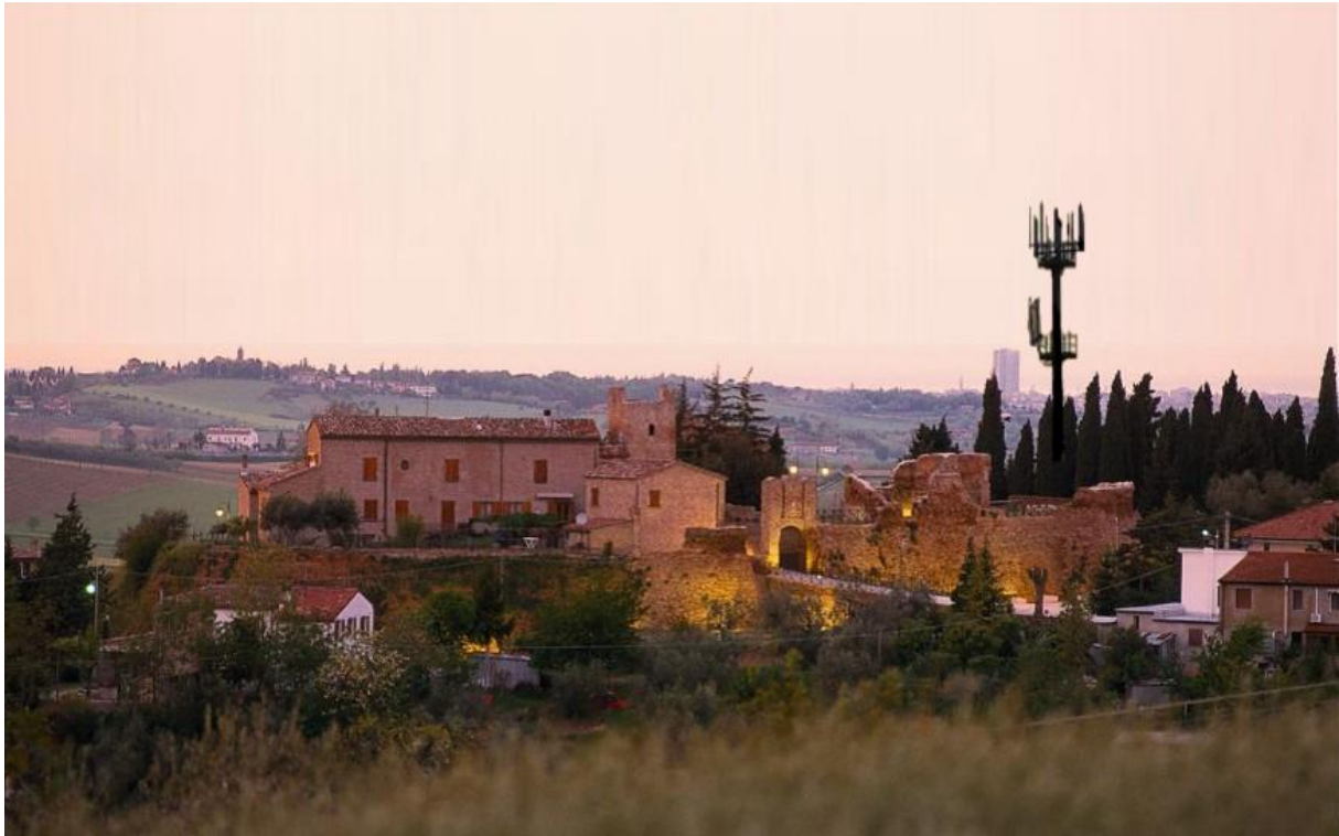
Antenna di telefonia mobile installata a fianco del castello medievale di Coriano nella Provincia di Rimini. ( www.chiamamicitta.it , 17/12/2020)