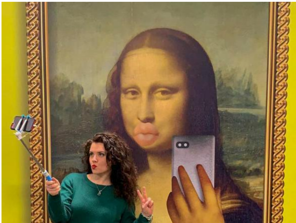
Il museo del selfie arriva in Italia, Corriere.it , 17/03/2021