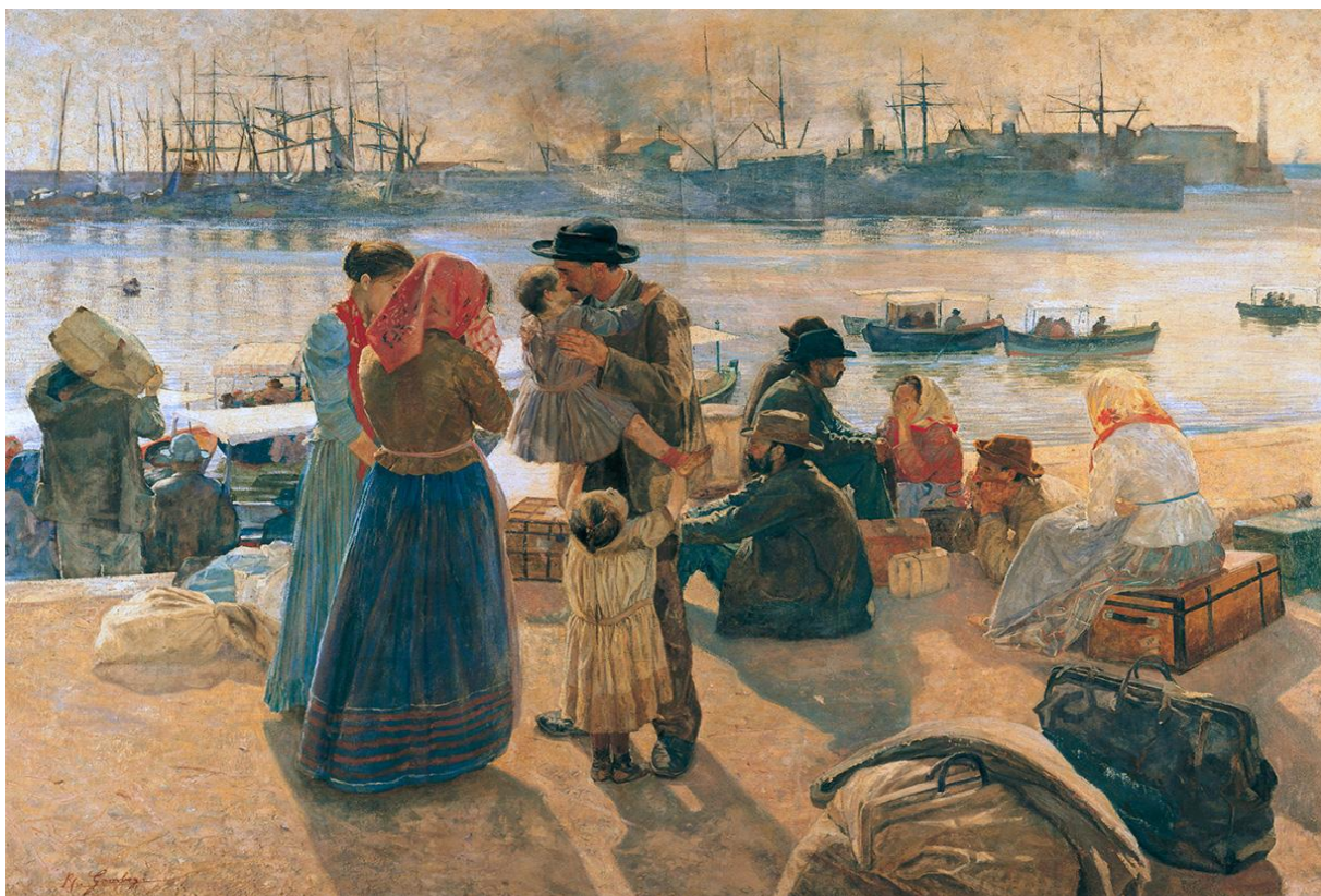
Raffaello GAMBOGI, Gli emigranti , 1893 (Museo Civico Giovanni Fattori, Livorno)

La partenza degli emigranti italiani in America a fine Ottocento